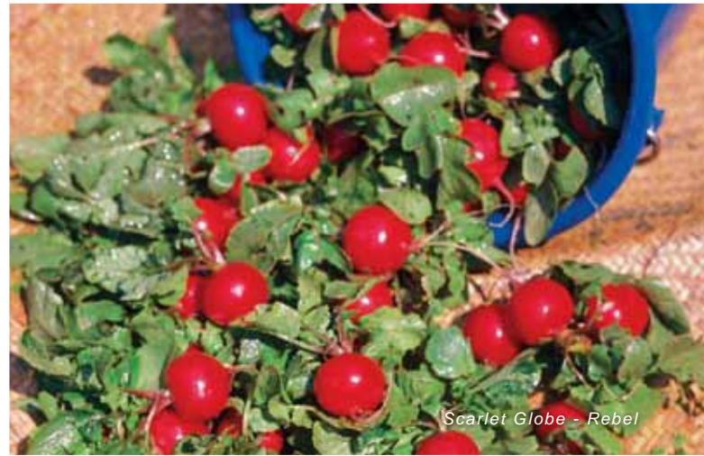
Scarlet Globe - Rebel